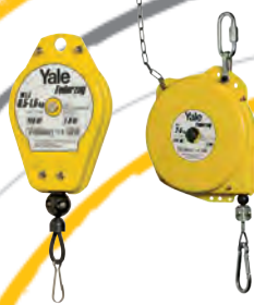
Equilibreurs à ressort YFS