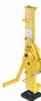
Crics à fût montant