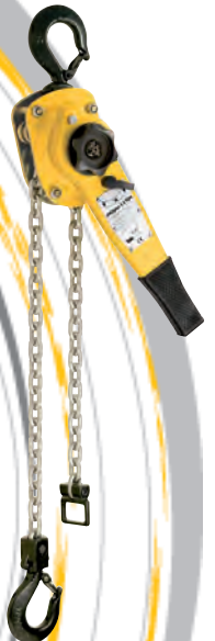
Palans à levier UNOplus