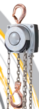
Palans manuels ATEX