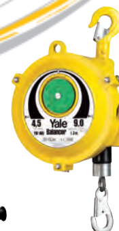
Equilibreurs mécaniques de charges