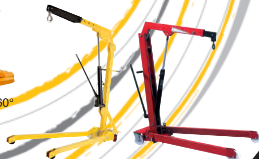
Grues d'atelier fixes ou pliables