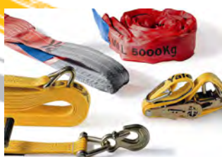
Elingues et sangles