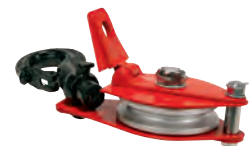
Accessoires de levage