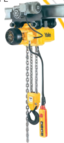
Palans électriques CPE