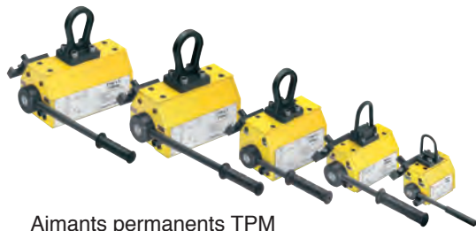
Aimants permanents TPM