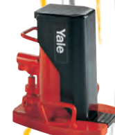
Crics à sabot