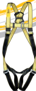
Harnais de sécurité Longes Anti-chutes