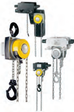
Gamme Yalelift Vario