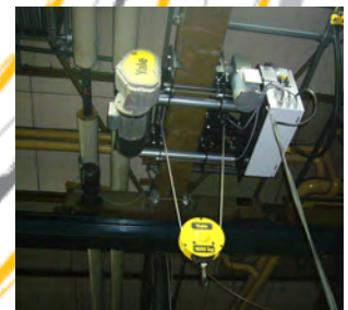
Palans à câble