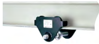
Chariots et griffes