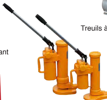
Crics hydrauliques 360°