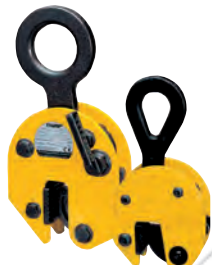
Pincas à tôle