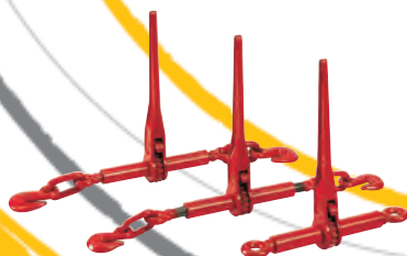
Tendeurs à cliquet