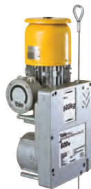
Treuil à câble passant