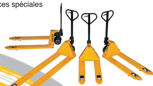
Transpalettes standard et spéciaux