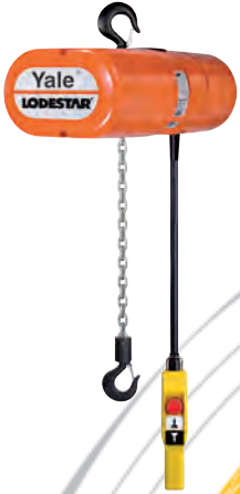
Palans électriques Lodestar